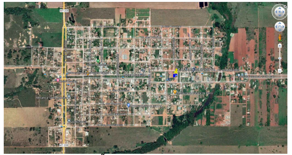
PLANTA DE LOCAÇÃO S/Escala