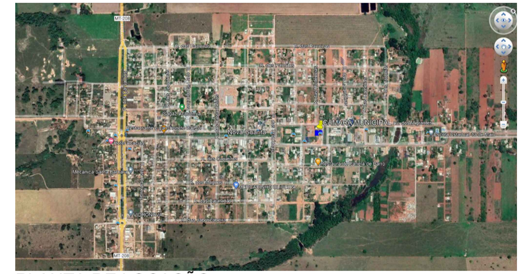
PLANTA DE LOCAÇÃO S/Escala